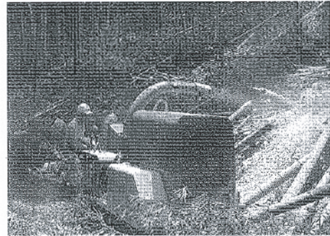
竹林の肥料にするため古い竹は切断する