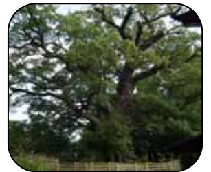
森 林 散 策